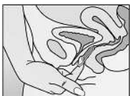
Abbildung 5 NuvaRing kann entfernt werden, indem man den Zeigefinger unter dem Ring einhakt oder den Ring mit Zeige- und Mittelfinger greift und herauszieht.