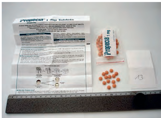
Abbildung 2: Die Tabletten wurden offen und ohne gesetzlich vorgeschriebene Verpackung in Plastiktüten verpackt, oft mit fremdsprachigem Beipackzettel.