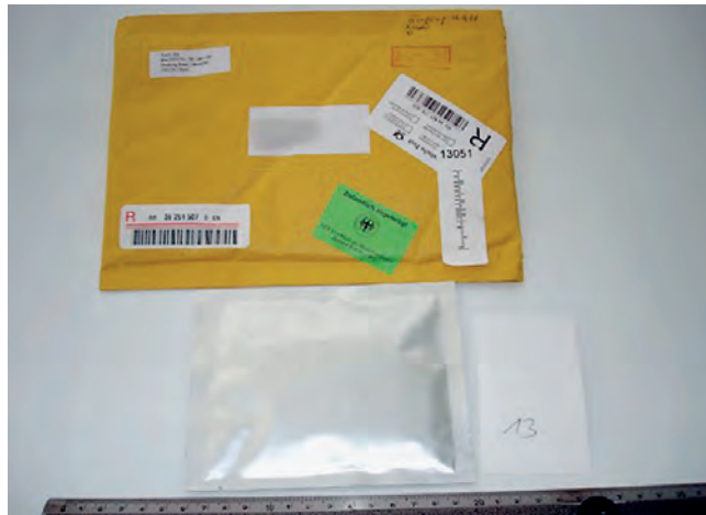
Abbildung 1: Sogenannte Propocia-Präparate werden in Briefen verschickt. Zur Umgehung der Zollkontrolle wird der Inhalt fälschlich als »gift« (Geschenk) deklariert.

Zudem ist das meist geforderte Bezahlen per Kreditkartennummer für den Pa-